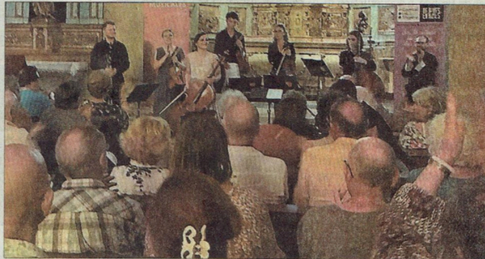
Le public était très enthousiaste.

Estagnols et touristes sont au rendez-vous depuis déjà trois ans et reviendront fidèlement en 2025 !